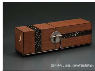
須田氏作：漆塗小櫃「雨通月映」